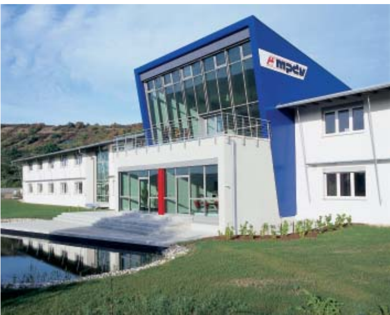
Notre siège social à Mosbach

Une présence décentralisée est assurée par les filiales MPDV Schweiz AG à Winterthur (Suisse) et CSI GmbH Société d'informatique à Sindelfingen (Allemagne) et grâce à une collaboration étroite avec des sociétés partenaires en Allemagne et à l'étranger. Nous mettons ce regroupement à profit pour effectuer un échange de savoir faire au niveau mondial, bien au delà des frontières régionales et structurelles.